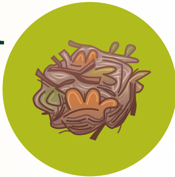
Yesca – varitas pequeñas, hojas, hierba o agujas secas.