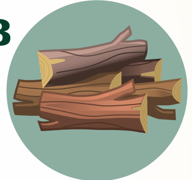
Leña – piezas más grandes de madera seca hasta de 10" de diámetro.